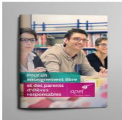
La plaquette institutionnelle