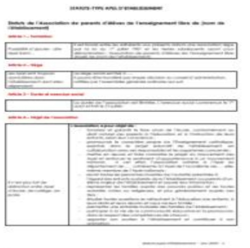
Les statuts-type d'Apel d'établissement