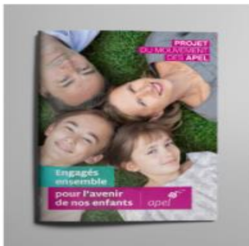
Le projet du mouvement des Apel